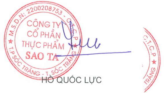
HỒ QUỐC LỰC